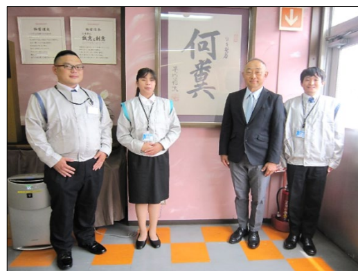
入社式を終え、シャープ創業者・早川徳次 直筆の書「何冀」の前で記念撮影 ※感染予防対策を十分にしておこなっています。